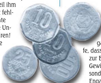
Sich zu engagieren bedeutet nicht einfach Geld zu geben, sondern die Verantwortung mitzutragen!

Doch sind etwa diese Aufgaben kleiner geworden in wirtschaftlich schwierigen Zeiten? Oder werden sie plötzlich unwichtig? Hat Gott Menschen in die Mission gerufen, damit sie von unserem Überfluss eine Zeit lang (d.h. solange es uns gut geht) arbeiten können, um danach von uns fallen gelassen zu werden?