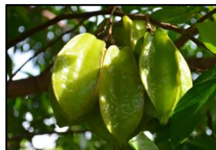
Pflanzen und Frucht