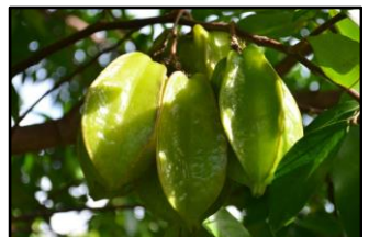
Pflanzen und Frucht