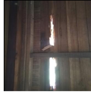
Termitenschäden im Comedore