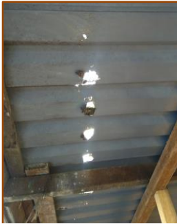
Dachbleche Küche defekt