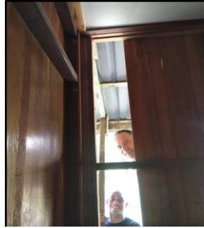
Schäden in der Wand