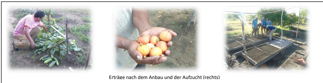
Erträge nach dem Anbau und der Aufzucht (rechts)